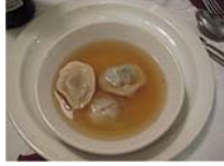
"Hiding" the meat inside the dumpling