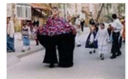
普陵節耶路撒冷街道